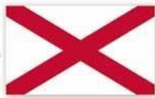
Irlande du nord