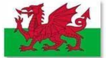
Pays de Galles