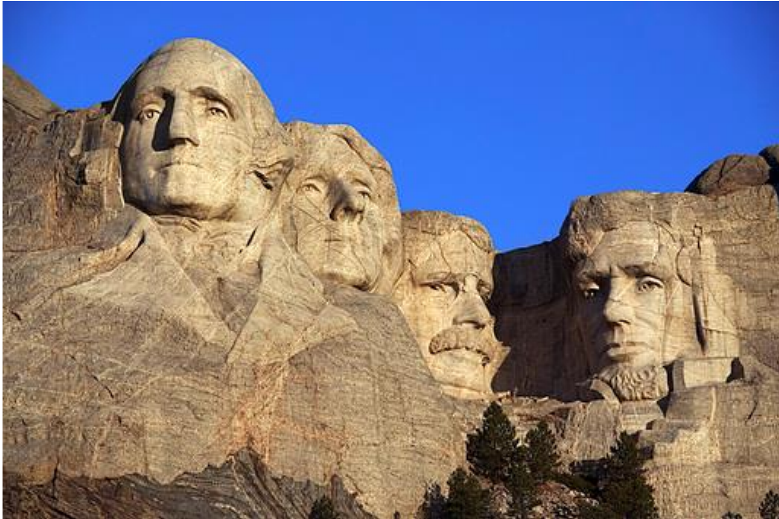
Le Mont Rushmore – 1923

C'est une sculpture célèbre de quatre présidents américains : George Washington, Thomas Jefferson, Theodore Roosevelt et Abraham Lincoln. Elle se situe dans le Dakota du Sud, aux Etats-Unis. Tout le monde peut le visiter.