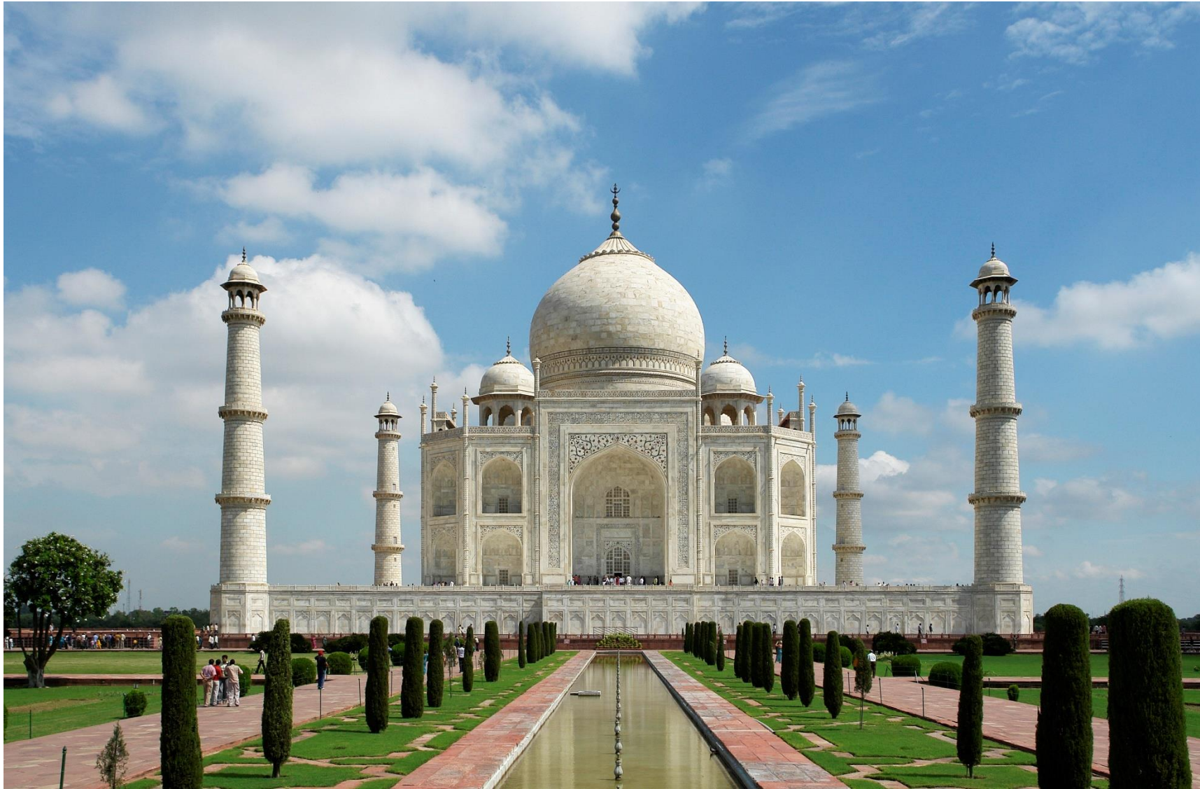
Le Taj Mahal – 1648

Le Taj Mahal a été construit en Inde avant que l'anglais ne devienne la langue du pays. C'est un empereur qui a fait bâtir ce monument en hommage à son épouse décédée. Il est très touristique.