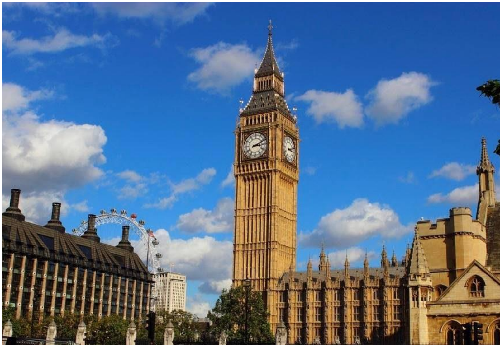
Le Big Ben – 1859

C'est le surnom de l'horloge au sommet de la Tour Elizabeth, au-dessus du palais de Westminster, où siège le parlement britannique. Seules les anglais peuvent la visiter.