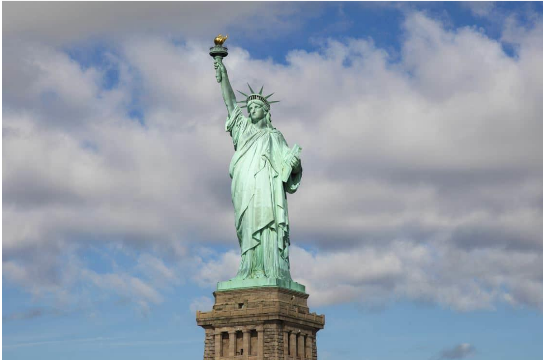
La Statue de la Liberté – 1886

Elle a été construite par les français et offerte aux Etats-Unis comme symbole de l'amitié entre les deux pays.