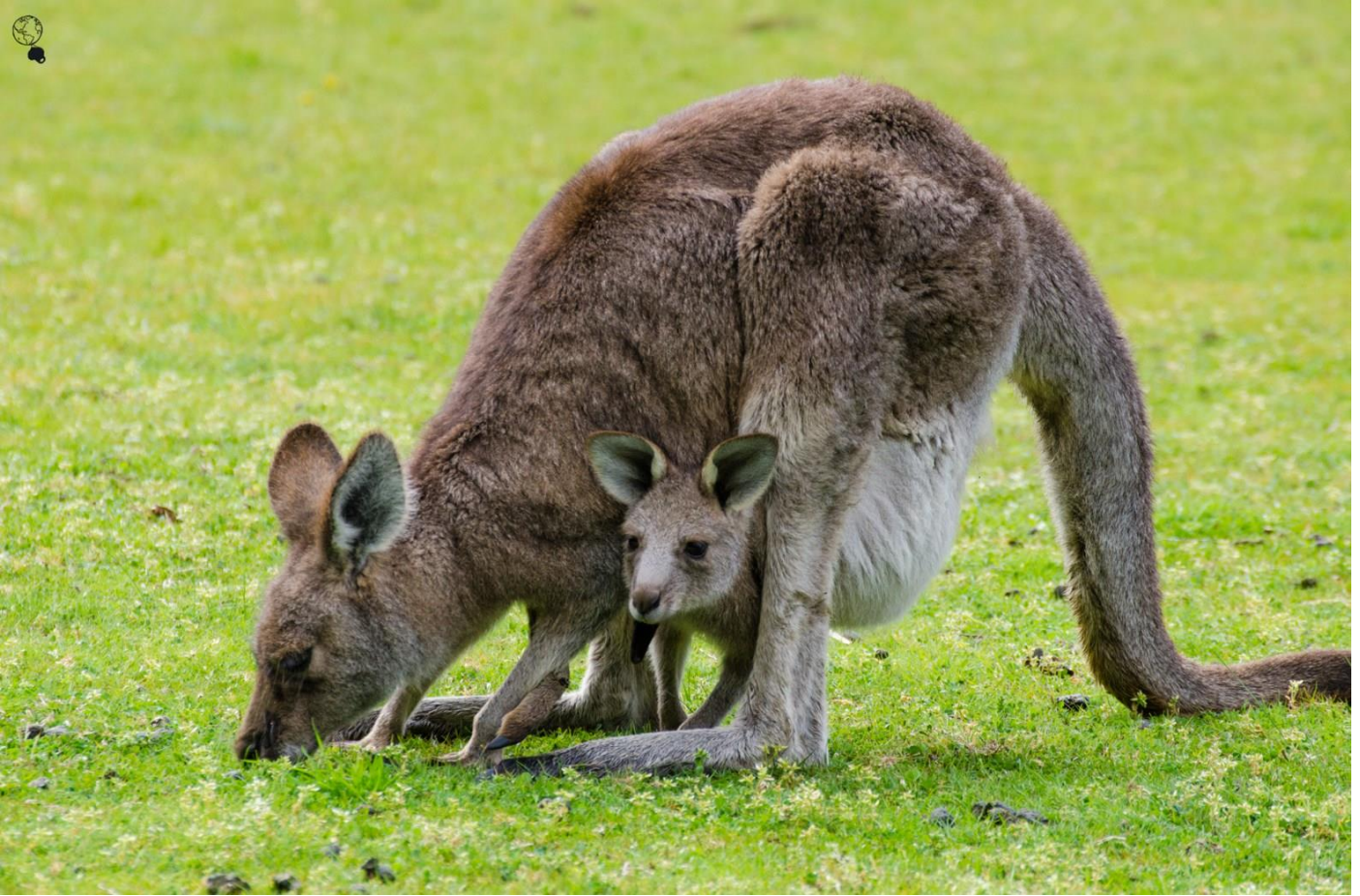
Un kangourou et son petit