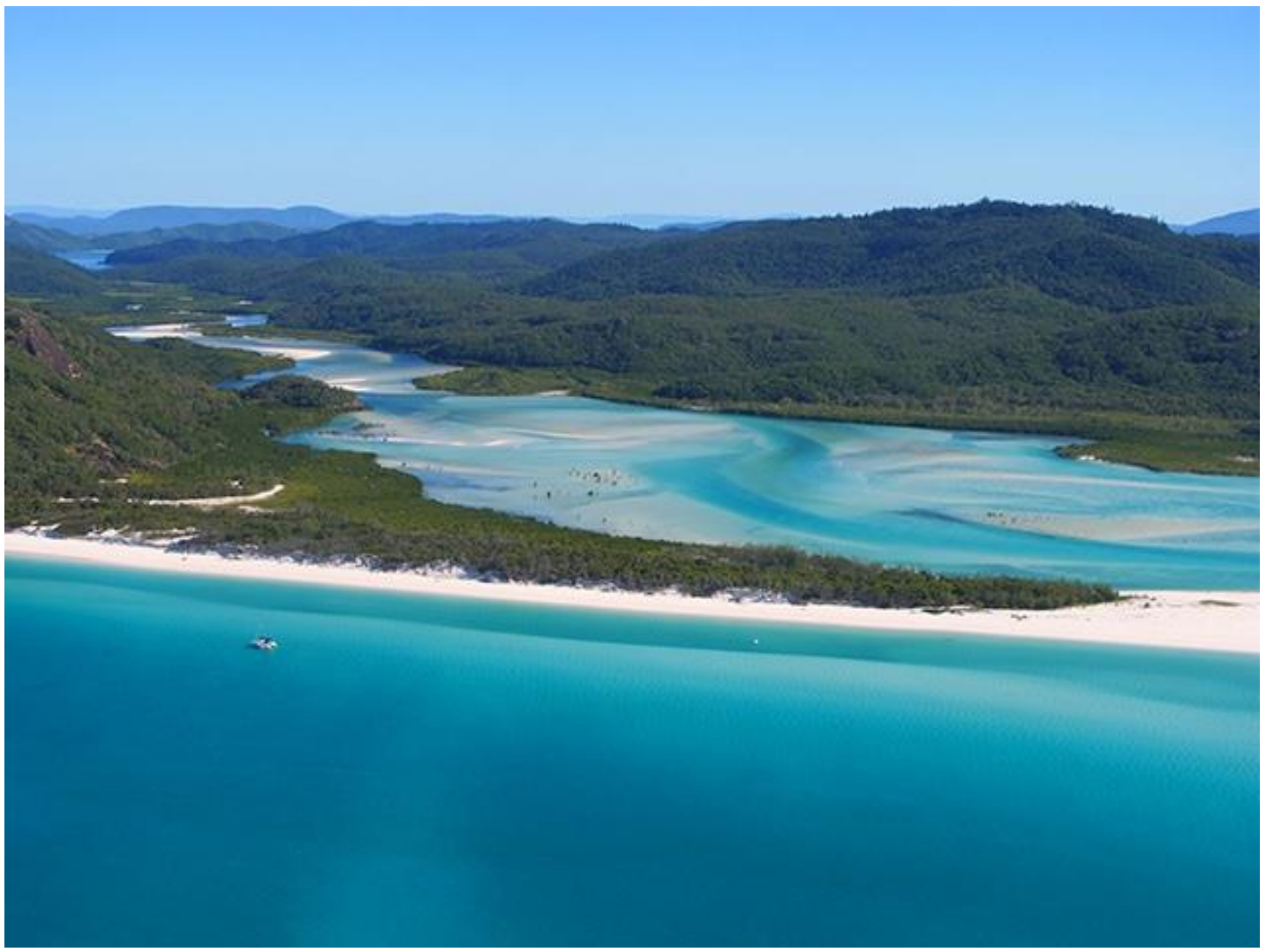
Une plage en Australie