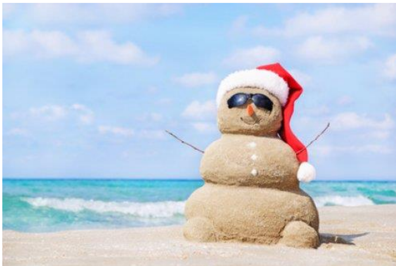
Noël en Australie