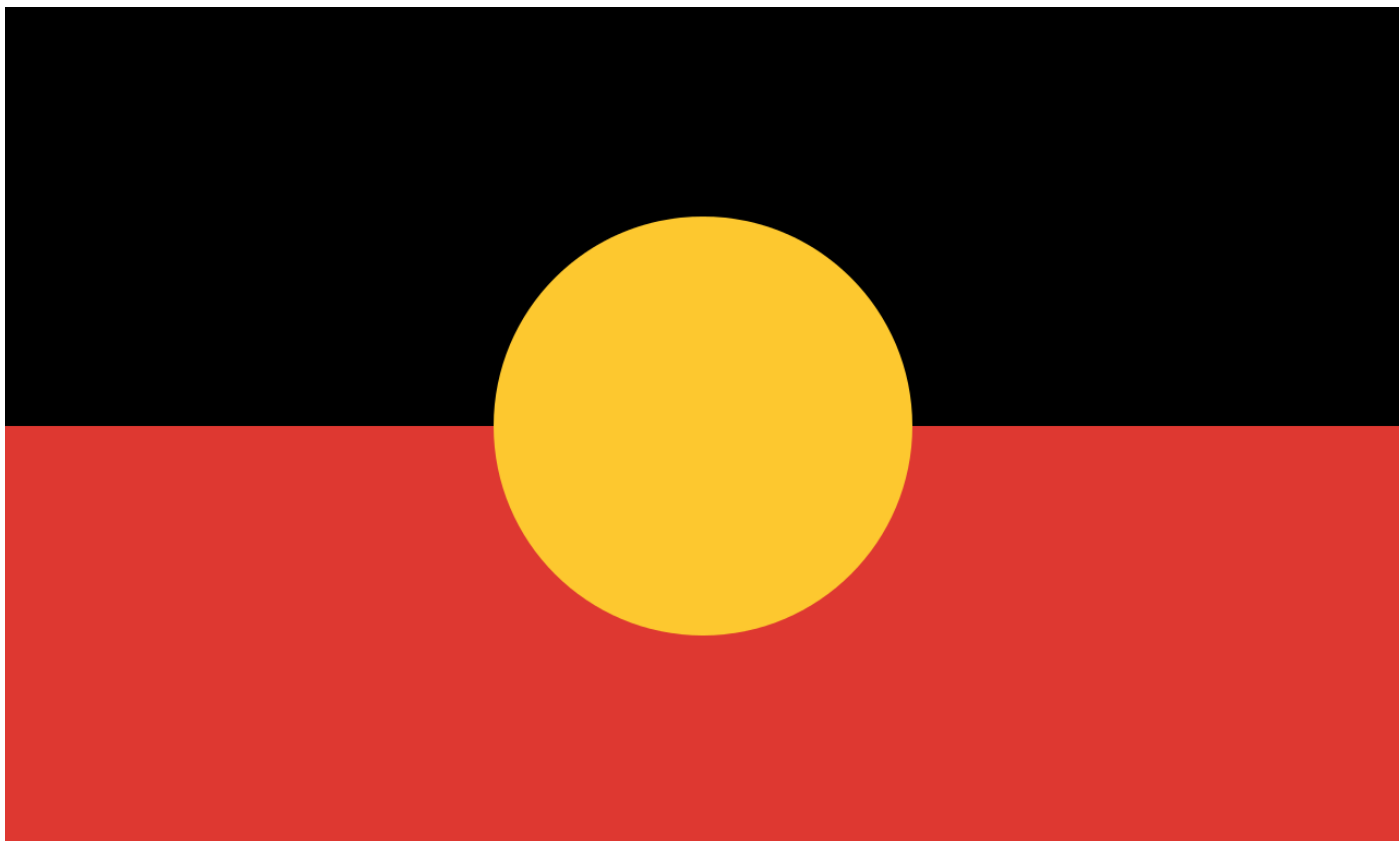
Drapeau aborigène qui représente la terre, le soleil et le peuple aborigène.