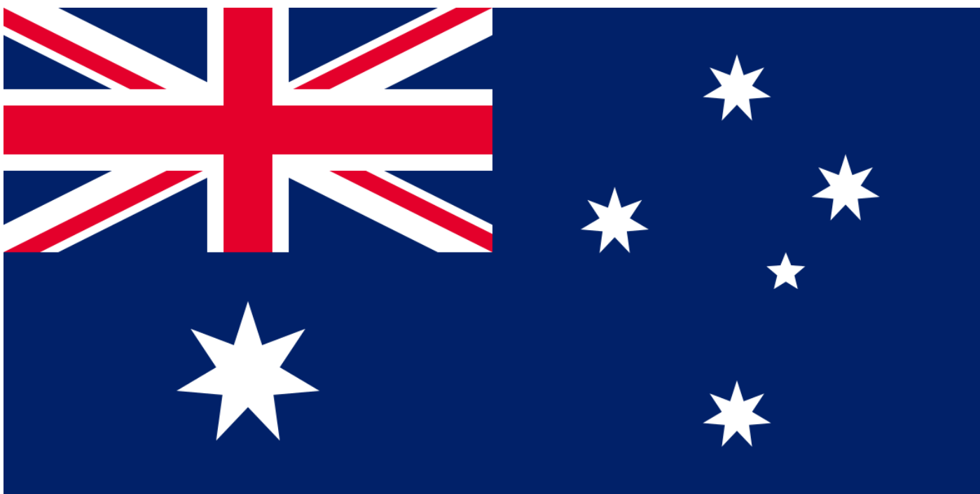
Drapeau australien, avec l'Union Jack (drapeau du Royaume-Uni) en haut à gauche. Les étoiles représentent des territoires australiens.