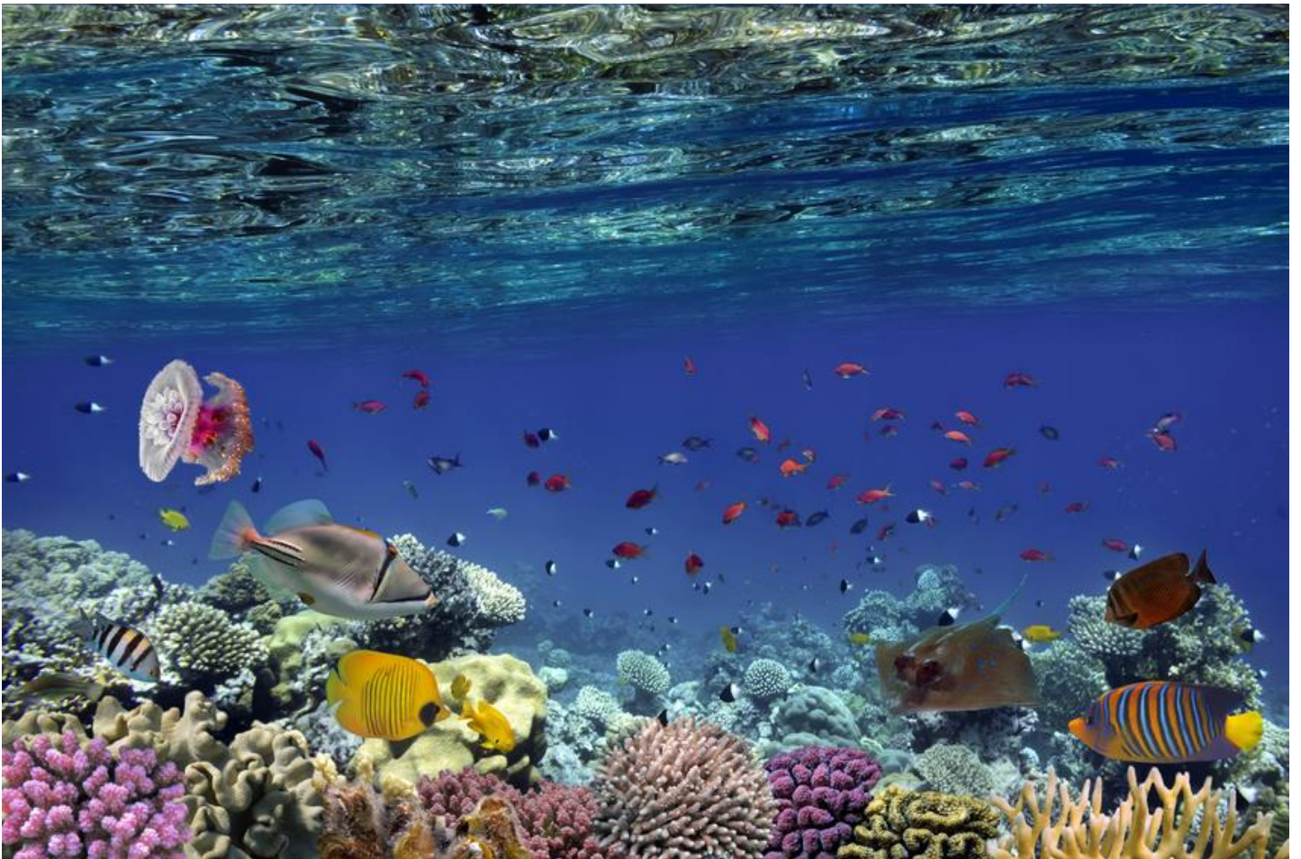
La Grande Barrière de Corail