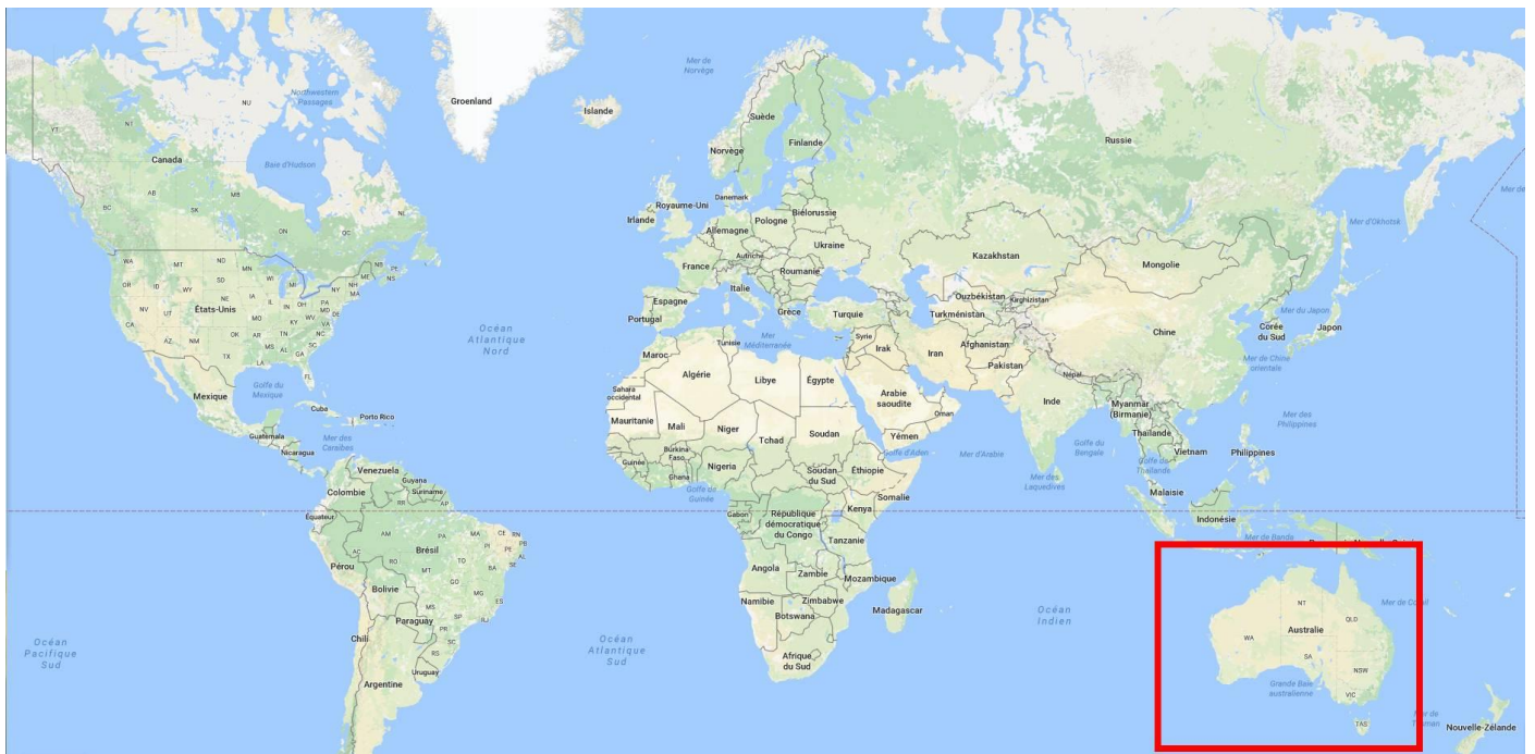
L'Australie dans le monde