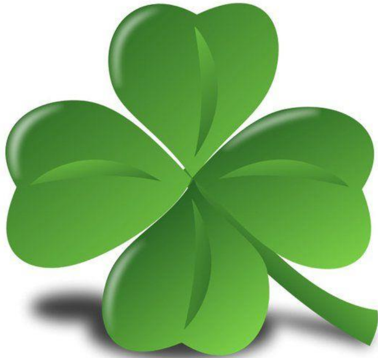
Un trèfle à quatre feuilles