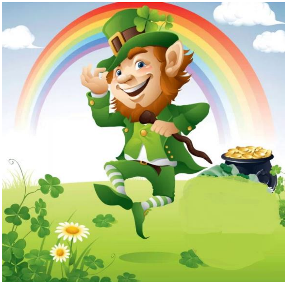
Le leprechaun et son trésor caché