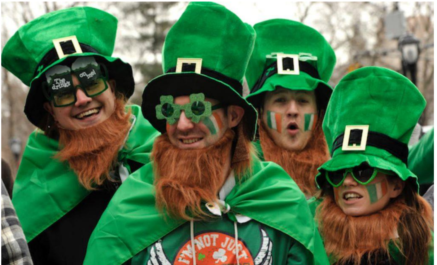
Les déguisements de la Saint-Patrick