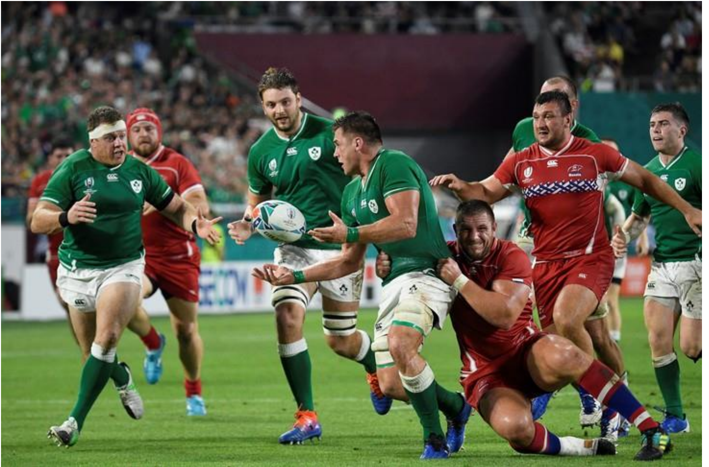
L'équipe irlandaise de rugby