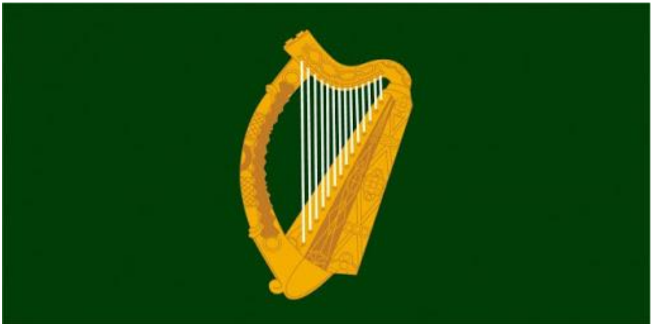
Une harpe celtique